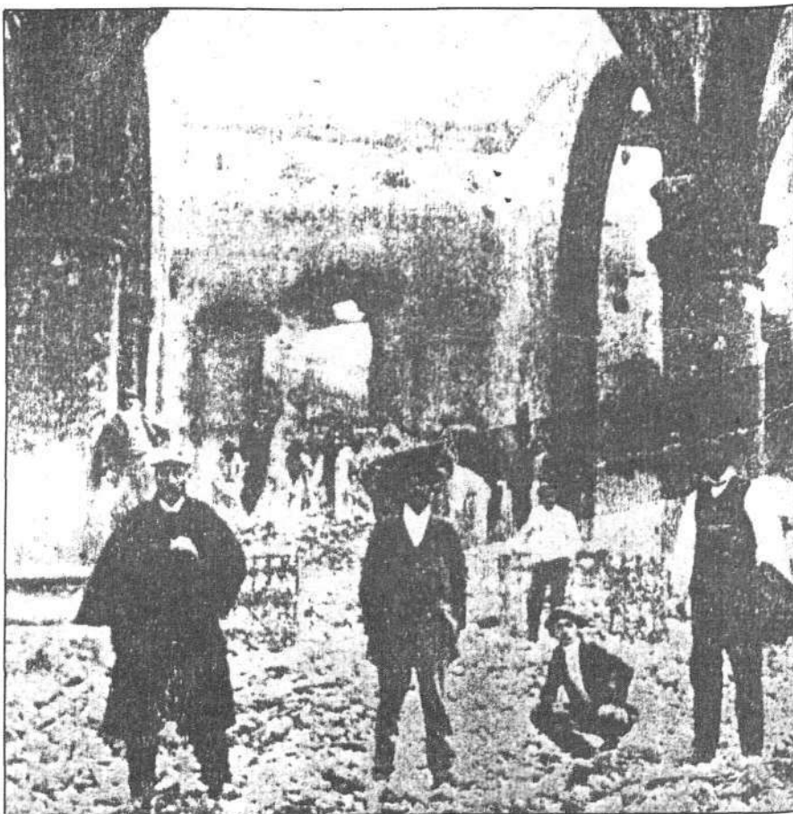
Ruinas de lo que fué altar mayor de la iglesia parroquial de Tegui se.

La iglesia quedó totalmente destruída en poco más de dos horas, habiendo sido ineficaces los esfuerzos que realizaron los vecinos y las autoridades para extinguir primero, y luego para localizar el voraz elemento.