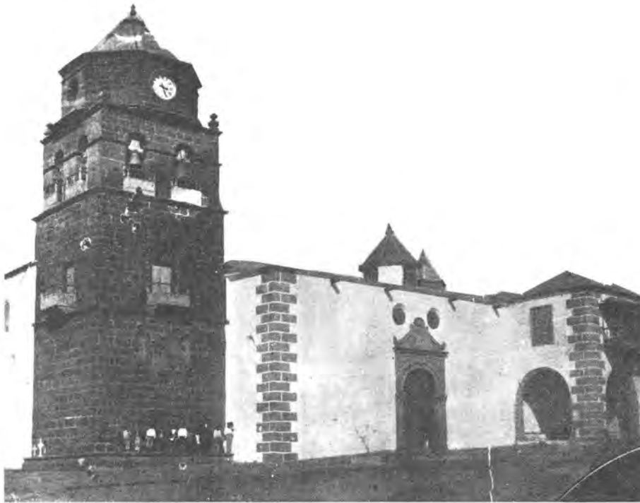
Antigua Iglesia de Tegui, antes del incendio de 1909. Fotografía hallada en un viejo caserón, impresa en un cristal, como placa fotográfica.

su deseo de que en la huerta de Famara, de su propiedad, se llevase a efecto la construcción de un monasterio de frailes y que fueran de la Orden de los Franciscanos sus moradores y dueños de esta misma huerta.