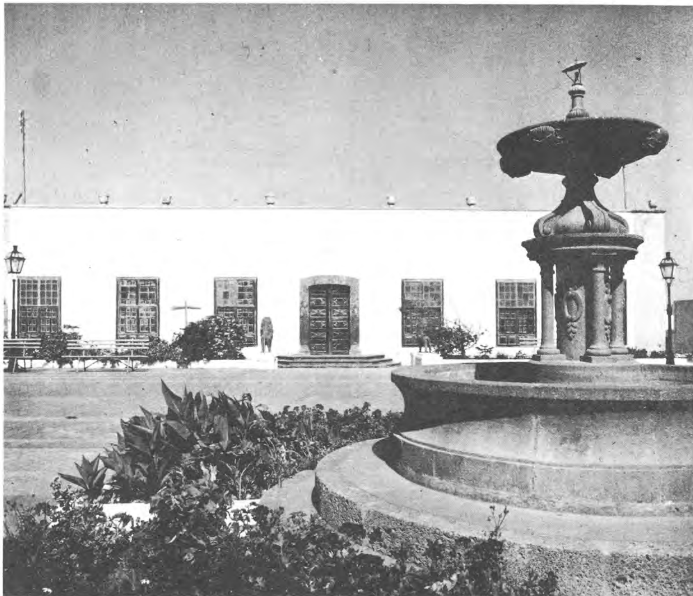
Plaza de Tegüise.

colmo de desdichas, después de ser restaurado sufrió un nuevo incendio, esta vez casual, el 6 de febrero de 1909, destruyéndose casi en su totalidad y con ello su maravilloso coro de cedro tallado, que al decir de muchos eruditos era único en Canarias. Sin embargo, y luchando esta vez contra la escasez de recursos fue erigido nuevamente, aunque lesionando considerable-