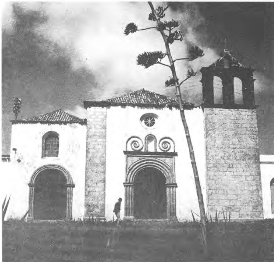
Iglesia de San Francisco.

Para ello consignó una donación de 500 ducados de oro. Por aquel entonces, épocas de continuas luchas contra los invasores, ofrecía poca seguridad para tal menester la huerta de Famara, pues por hallarse